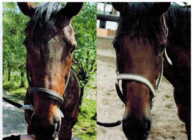
Foto links: Craniosacraal therapie is een holistische techniek. Foto rechts: Voor- en na-foto: kijk naar het verschil tussen de stand van het linker oog (rechts op de foto) en de neusgaten.